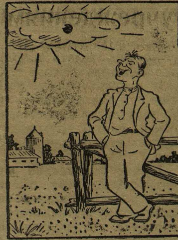
Настроение есть, солнышка нет...