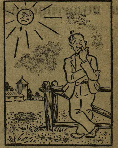
Солнышко есть, настроения нет...